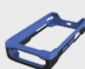
• 94ACC0132 Protezione in gomma