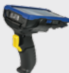
• 94ACC0170 Impugnatura a manico di pistola