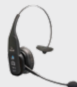
• 94ACC0127 Bluetooth Headset VXi B350-XT