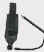
• 94ACC0133 Cinturino per impugnatura manuale (compreso con l'acquisto)